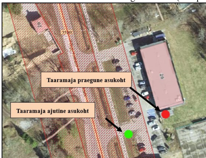
Joonis 1. Väljavõtte asendiskeemist

Olete taotlenud Transpordiametilt nõusolekut Harju maakonnas Lääne-Harju vallas Laulasmaa külas Kloogaranna tee 26 kinnistul (katastritunnus 43101:001:2178) paikneva olemasoleva konteineri tüüpi taaramaja ajutiseks (perioodil 03.06.-04.11.2025) paigaldamiseks riigitee nr 11390 Tallinna-Rannamõisa-Kloogaranna tee (edaspidi riigitee ) kaitsevööndisse (vt joonis 1 ).